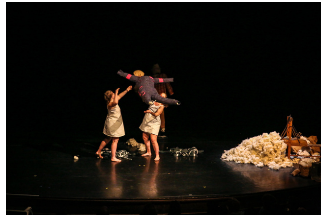
Théâtre Mansart, Dijon - 31.03.23