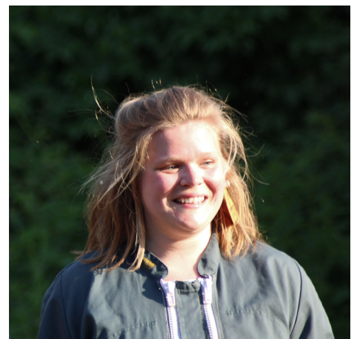
Vauchonvilliers - 27.05.23