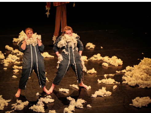
Théâtre Mansart - 30.03.23