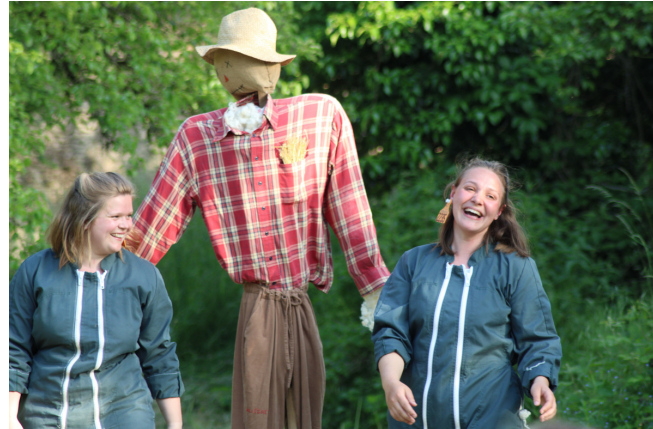
Vauchonvilliers - 27.05.23

Le passage des sous-vêtements à la cote marque la mise au travail des personnages. On peut voir par ce changement de costume l'évolution du temps. Les actrices enfilent leurs cottes mais restent pieds nus, ce qui contrebalance le concret de la combinaison. Ce décalage significatif nous rappelle qu'il s'agit là de théâtre et que la réalité du monde agricole se trouve dans les champs.