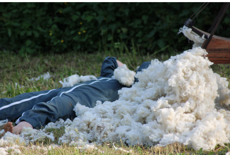
Vauchonvilliers - 27.05.23

Le premier espace que ce spectacle explore est celui du public. Dans une volonté de transmission la plus directe possible, les deux agricultrices cardent la laine de leurs moutons au milieu des spectateurs.