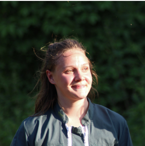
Vauchonvilliers - 27.05.23