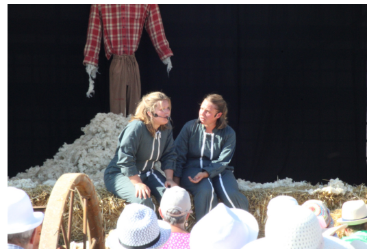
Fête de l'agriculture de l'aube - 20.08.23