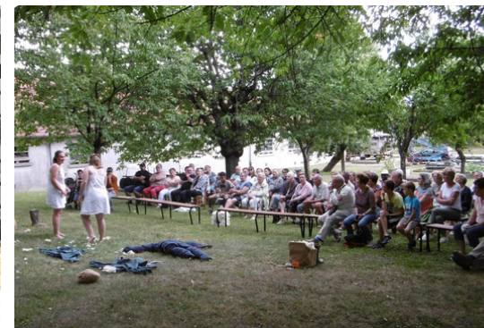
Ecomusée de Brienne la Vieille - 23.07.23