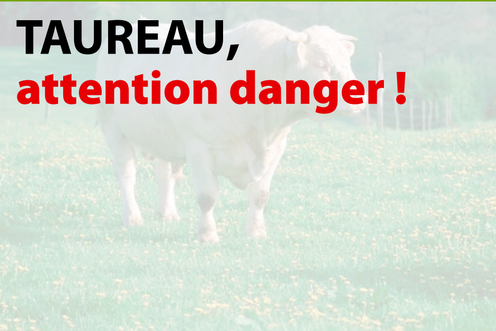
Fiche réalisée avec le soutien de Francis Nécaille, formateur national manipulation-contention des bovins agréé par l'Institut de l'Élevage.

Les taureaux de monte naturelle sont fréquemment à l'origine d'accidents tragiques, qui pourraient être évités par une meilleure connaissance de leur particularité comportementale et psychologique, ainsi que par le respect de règles élémentaires de prudence.