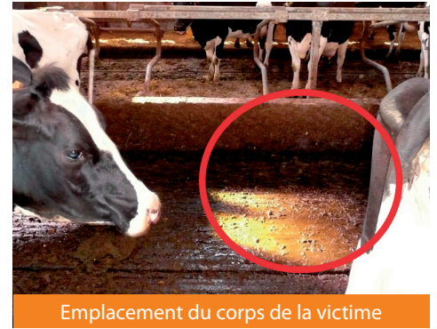
Emplacement du corps de la victime